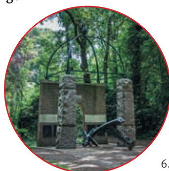
6. Bos van Wijckerslooth

In de Hollandse kuststrook treffen we plaatsnamen aan die eindigen op “geest”. Oegstgeest is er een voorbeeld van. Het woord duidt van oorsprong op hogere zandige gebieden gelegen in een natte omgeving, zoals de zandruggen van de oude duinen langs de kust. Ook de namen van enige buitenplaatsen waarlangs deze route leidt eindigen op hetzelfde woord. Zo voert de wandelroute over het terrein van kasteel Oud-Poelgeest. Verder komt u langs het Bos van Wijckerslooth, de buitenplaatsen Rhijngeest en kasteel Endegeest en eveneens door het als volkspark aangelegde Leidse Hout. De historische parken van de buitenplaatsen zijn, evenals de Leidse Hout, (deels) openbaar toegankelijk.